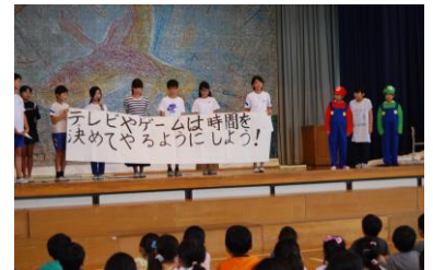
全校【保健委員会】保健集会（7.13）

地域・保護者の皆様のご理解・ご協力で、1学期を終えることができました。どうもありがとうございました。