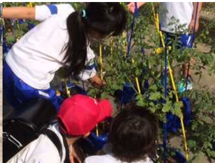
毎日、ミニトマトがいくつ収穫できるか楽しみにしている2年生