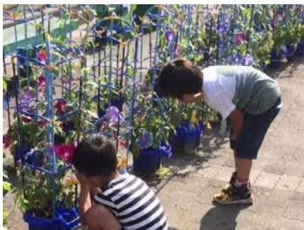
たくさんの花を咲かせるアサガオに大喜びの1年生

中庭で、1年生はアサガオ、2年生はミニトマトを栽培しています。朝、登校してくると、子供たちは、アサガオやミニトマトに水をやっています。「あ、花が咲いてる!」「トマトが赤くなってきた!」など子供たちの歓声が響きます。植物も元気な梅雨の時期、雑草も目立ち始めました。掃除の時間は、3年生が一生懸命校庭の草取りをしています。その働きぶりは見事です。校庭が見る見るきれいになっていきます。子供たちもたくましく成長した1学期でした。