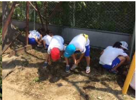
掃除の時間、せっせと草取りをする元気いっぱいの3年生

1学期ももうすぐ終了です。6・7月、学校ではたくさんの行事があり、児童会では高学年がリーダーシップを発揮する場面が多くありました。子供たちは、教科の学習だけでなく、いろいろな行事や活動を計画・実行することによって、心身ともに成長していきます。