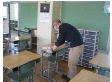
児童下校後に水道の蛇口や机いすの消毒