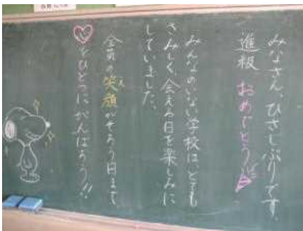
児童へのメッセージ