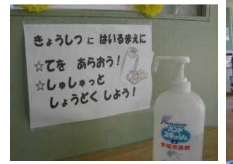
トイレの後など感染防止