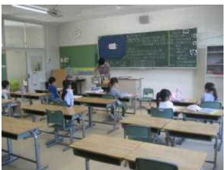
課題の取組状況の確認