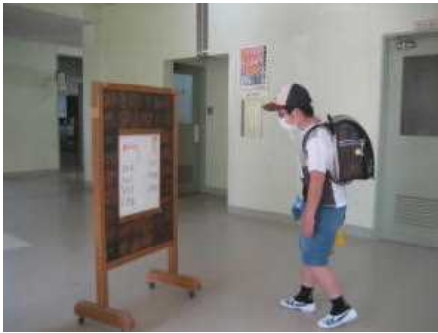
表示を見て教室までどこを通るか確認（動線の固定）