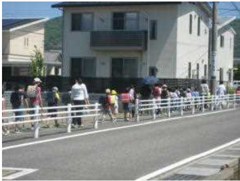
地区担当職員も一緒に集団下校