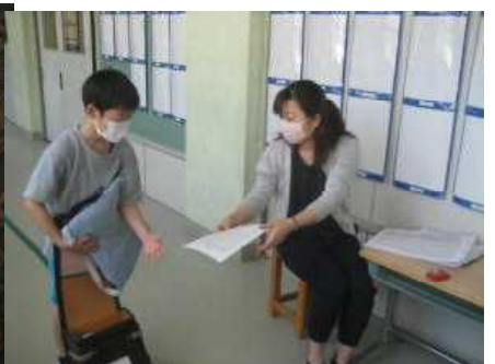
教室に入る前に健康チェック