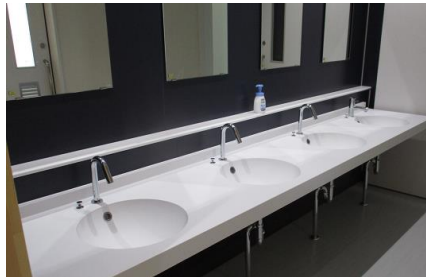
⑥洗面所（手前3つは自動）