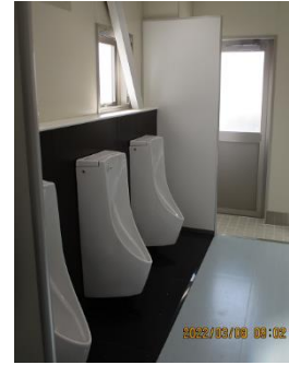
④男子トイレ （男女とも外 からも入れ ます）