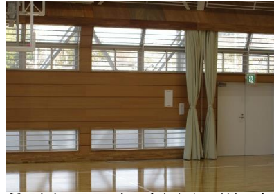
②壁と通風窓（東側の様子）