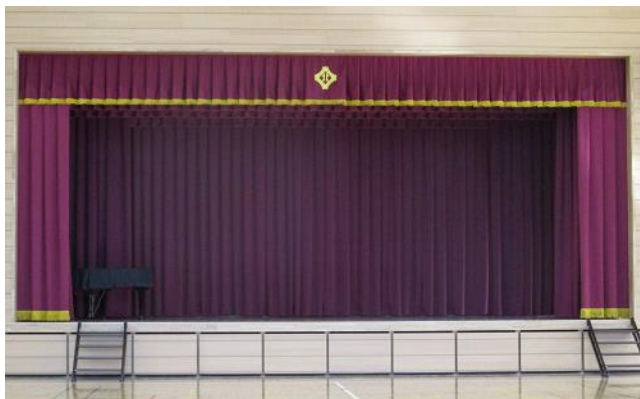
⑧舞台（幕、照明、スクリーンなどすべて 新しいものになりました。）