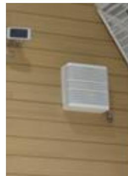
⑩換気ファン （4か所設置 されました）