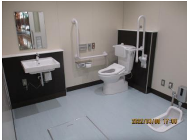
⑤多目的トイレ（避難所として 使うため和式もあります）