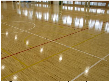
①床の様子（ぴかぴかです）