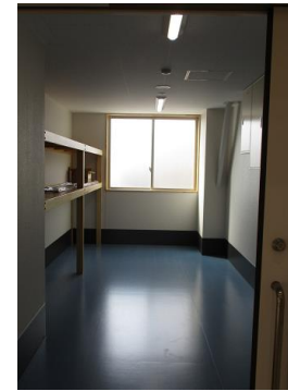
⑨体育器具庫 （4か所あり ます。）