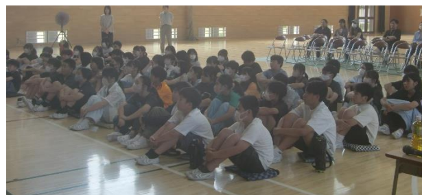
6年生 薬物乱用防止教室 (学校保健委員会)