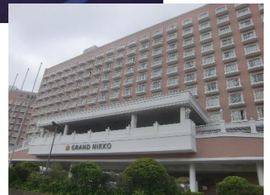
2日目のホテル グランドニッコー東京ベイ舞浜