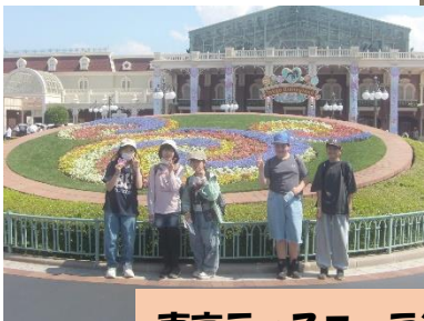
東京ディズニーランド