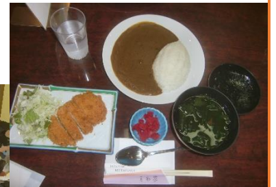
3日目の昼食 カツカレー