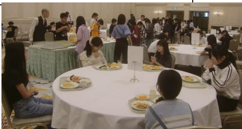
3日目の朝食 ~バイキング~