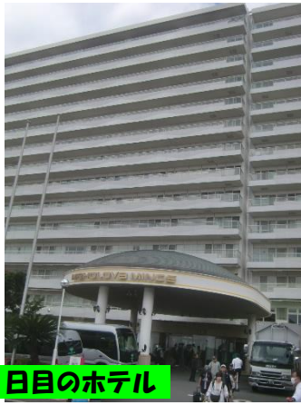
1日目のホテル マロハマインズ三浦