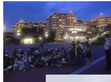
2日目の夕食は、各自ディズニーランドで・・・