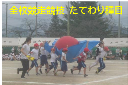
全校競走競技 たてわり種目