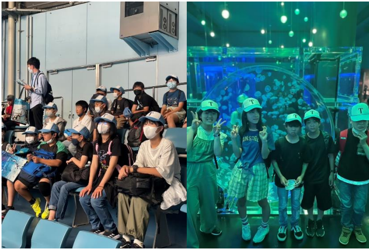
アクアパーク品川