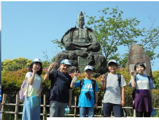
源氏山公園 頼朝像