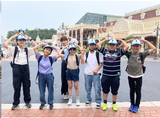
ディズニーランド