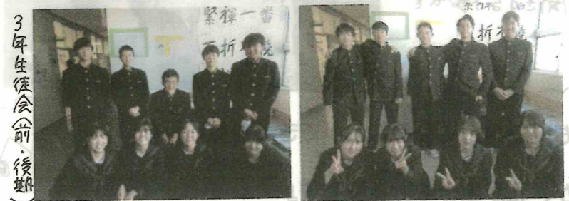
3年生徒会(前期・後期)

1学期から、学年生徒会や委員会活動もがんばっています。2学期の様子を紹介すると... ☆ 3年学年生徒会は、どうしの取組をしているようです。チェック表を作り、しっかりとしたクイズには、「ごほうびステッカー」を渡し、学年の取り組み表として3つ下に掲載しています。(どうじをきちんとやる学年は立派です)