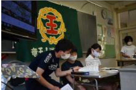
議長と本部提案の様子です。

三密を回避しながら児童総会を実施するため、今年度は校内のタブレットや大型テレビ等を駆使して、各教室の双方のやりとりができるリモートでの開催となりました。事前から職員が何回もリモートのテストを行いながら、実施まで進むことができました。本部からの提案に対して、各クラスの質問や意見を発表してもらい、体育館で行っていると同様の話し合いが進められました。児童会本部の取組、各クラスの事前の話し合い活動、リモート中の各先生方の対応、新しいスタイルでの活動が見られ、とても新鮮な気持ちとなりました。