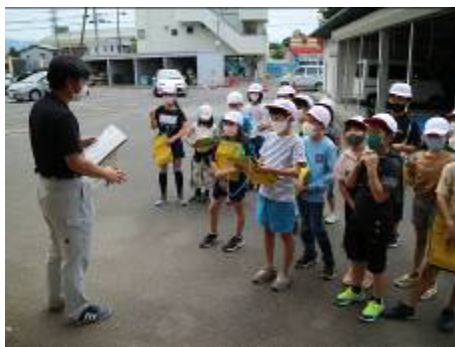
係の方から細かい説明を聞きました。

5月24日(月)に4年生は上水道の学習として、甲斐市水道事務所へ足を運びました。蛇口をひねると当たり前に出てくる『水』のありがたみをあらためて学習することができました。帰校後には、びっくりと書けたメモを見せてくれたり、もらった『竜王源水』のペットボトルを大事そうに抱えて、よい学習に結びついたようです。とても水に恵まれている甲斐市。だからこそ今回の学習を今後にもより活かしてほしいと思いました。