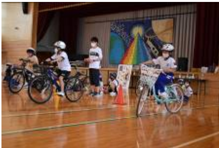
自転車に乗ってレッツゴー。

3年生が5月19日(水)、1年生が5月26日(水)に交通安全教室を実施しました。3年生は自転車の乗り方、1年生は基本的な交通ルールを学びました。毎日何気なく歩いている道路、いろいろなところで活用している自転車、安全に行うために気をつけなくてはならないことを丁寧に指導していただきました。落ち着いて視野を広め、危険を回避することができ、大切な命をしっかりと守ることができるよう、今回の学習を活かしてほしいです。