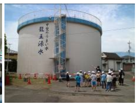
竜王源水の大きなタンク。