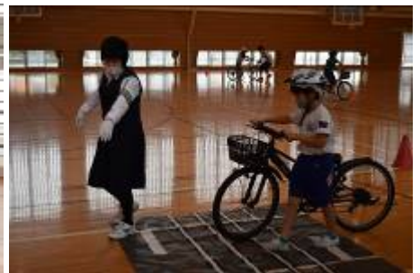
踏切では自転車は押して進みます。