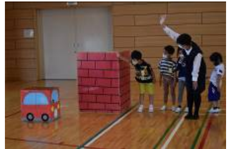
見えにくい場所もしっかり確認。