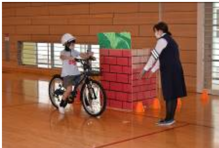
一時停止、左右の確認が大事。