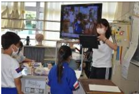
タブレットから意見発表をします。文字でも伝えられるよう映し出しています。委員長からの発言もありました。