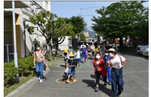
朝は元気なあいさつでスタート！

5月末日まであとわずか。令和3年度がスタートして早くも2ヶ月が経とうとしています。また、1学期の半分が終了し、後半に入ることの意味しています。過ぎてみると月日の経つのはたいへん早く、本校の児童も一日を大切に過ごし多くのことを学びながら成長しているよう感じています。これからは梅雨のジメジメした天候と同時に、熱中症等に関心を持ってはなりません。持参した水筒で水分補給をしながら、暑さに体を慣らしつつ、元気に活動できることを祈っています。また、先日お知らせしたように新型コロナウィルス感染症の拡大予防のため、5月に引き続きいくつかの行事を見合わせる措置を執らせていただきました。ご迷惑をおかけしますが、ご協力のほどよろしくお願い申し上げます。