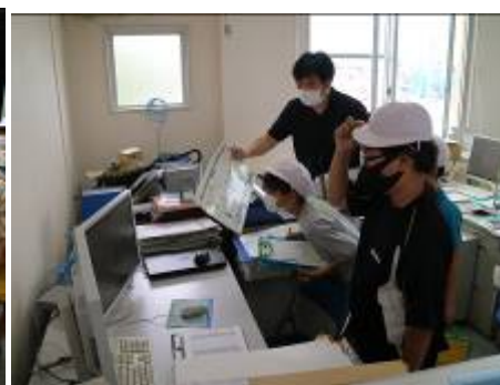
管理しているPCの見学です。