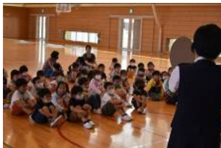
最初に説明をしっかりと聞きました。横断歩道の前では右手を挙げて！