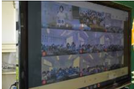
各クラスの様子はテレビで映します。クラスでは役員中心に意見まとめます。