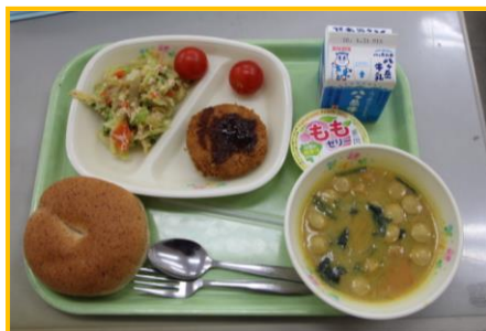
1/24 ふるさと給食③ 赤坂トマト、 甲州ワインビーフ、ゆばサラダ、桃ゼリー