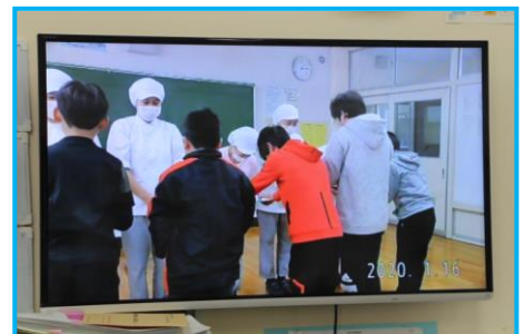
1/21・22 給食集会ビデオ放送 調理員さんへ感謝状のプレゼント