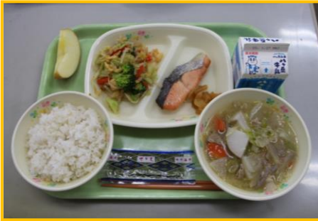
1/20 昔の給食① とん汁、さけの塩焼き、つけもの

1月20日（月）～24日（金）は、給食週間でした。甲斐市や山梨県の地元の食材を生かした料理や郷土料理が毎日出されました。また、給食集会で、給食委員会から毎日おいしい給食を作ってくださいる調理員さんに感謝状を贈りました。竜王小学校の給食はとてもおいしくて、子どもたちは毎日楽しみにしています。