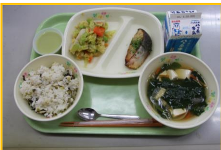
1/23 ふるさと給食② 鳴沢ごはん ぶりのゆず生姜焼き、やはたいもサラダ、桑の葉プリン