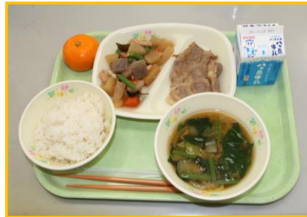
1/21 ふるさと給食① 富士桜ポーク、甲州みそのみそ汁