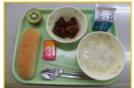
1/22 昔の給食② コッパン、くじらのオーロラソース和え