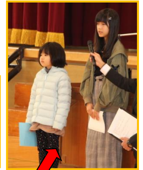
終業式での1年生と6年生の素晴らしい発表！