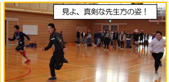
見よ、真剣な先生方の姿！