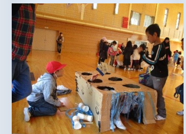
時間をかけて作った出店で楽しみました