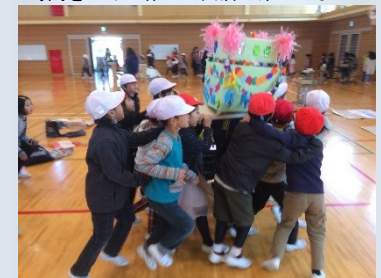
まつりの最後はお神輿わっしょい！