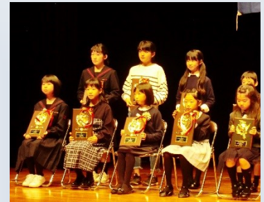
記念の楯を頂き、受賞者全員で写真撮影！

12月13日(水)3・4校時に児童会役員選挙の立会演説会をおこないました。演説の内容が「甲斐市で一番の学校にしよう。富士山のように一番の学校にしよう！」など、竜王小小学校をよりよい学校にしようという演説が多く見られました。子どもたちの愛校心が高まってきたことが伺える内容でした。5年児童会長・5年副会長各3名、4年副会長それぞれ2名ずつの候補者と責任者16名が