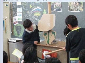
八幡芋について調べたことを発表！