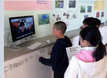
TV 電話で院生から調べ方を教えてもらいました