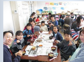
豚汁も衣かつぎもおいしかったね！