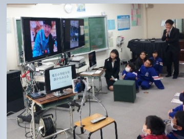
大槌学園とのテレビ電話交信をした 5 年生