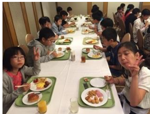
修学旅行 3 日目の活動（2016 年 5 月 13 日）