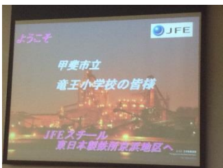
【修学旅行 JFE 東京タワー】(2016年5月12日)