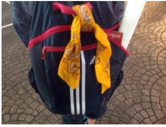
時計台でのショー