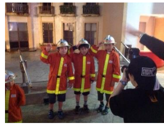
警備員になって館内を巡視 はとバスで館内一周 デパートの店員さんにも