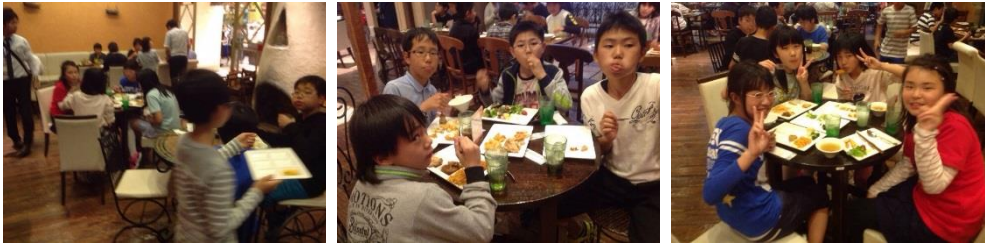
【修学旅行 3 日目 朝食】（2016 年 5 月 13 日）

ベーコンやスクランブルエッグなどの洋風メニューと、焼き魚や納豆といった和風メニューがあり、自分で好きなものを選んで食べました。みんな元気に朝食を済ませた後は、退所の集いでホテルの係員さんにお礼の言葉を述べ、 8 時 40 分 にアートホテルズ大森を出発し、科学技術館に向かいました。（文責 増坪）