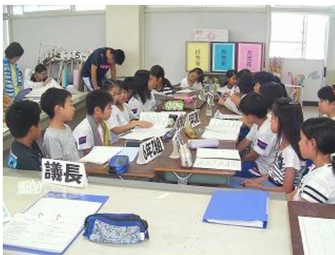
『親子レク 6年』(2016年6月28日)