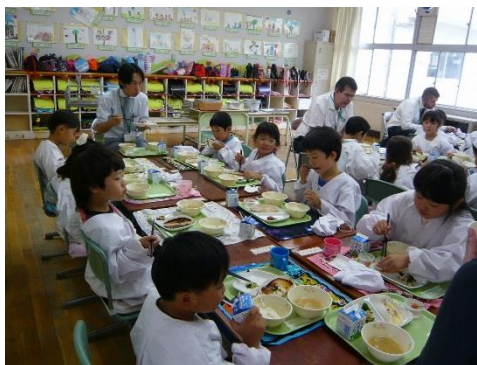
「第3回代表児童会」(2016年6月27日)

27日(月)中休みに第3回代表委員会を行いました。6月の生活目標の「廊下や階段を静かに歩こう」については、守ることができなかったという反省が多く寄せられました。また、「自分から元気にあいさつしよう」については、意識の高まりが見られました。これからはあいさつ運動に意欲的に取り組んでいきたいと思えます。