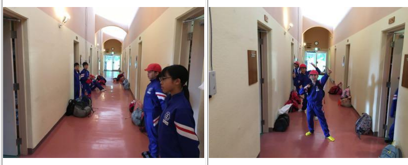
林間学校2日目♪Part,2 (2016年6月8日)

退室前の部屋のチェック待ちです。朝食前に布団を整えるだけでも思うように行かず、何度も整とんした子ども達。先生方にチェックしてもらいました。食後は掃除をし、荷物を片付けました。自然の家の方がチェックしてくださる前に、それぞれ再度点検しましたが…実際に合格を頂き、「ヤッター!!」