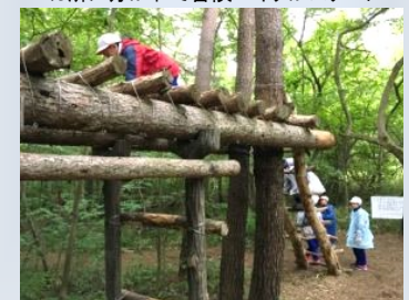
チェックポイント2「レンジャー」は見た目より怖い丸太渡りでした…