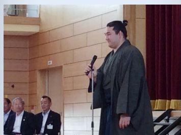
横綱を目指して頑張ることを決意！