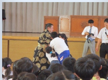
恐るべし「勝武士」！6人の小学生ではびくともしません。