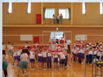
5月31日に行われた竜王北ブロック親睦球技会！