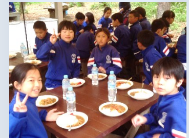
みんなで協力して作ったカレーは格別の味！