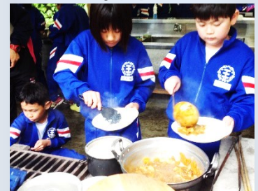
ごはんもふっくら炊け、濃厚なカレーとマッチング！