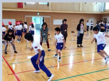
反復横跳びの回数を真剣に数えてくれました

今年の竜王小学校は勝利の数がこれまでの中で断然トップになりました。それでも最後の試合で競り負けると、悔し涙で目を赤くする子どもも見られました。修学旅行後、練習日数が少ない中でしたが、チームワークの大切さを感じた時間でした。子どもたちの姿を見て、心がとても温かくなりました。