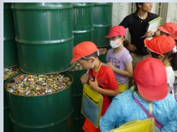
集められた電池のドラム缶がたくさん！