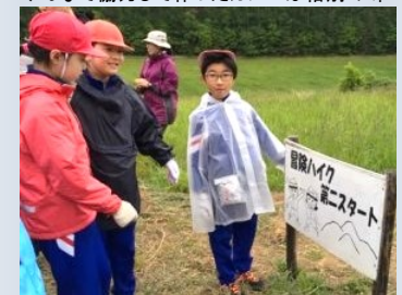
2カ所に分かれて冒険ハイクがスタート！