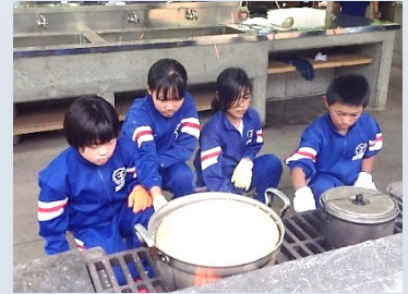
野菜を切った鍋には少なめの水を入れました！