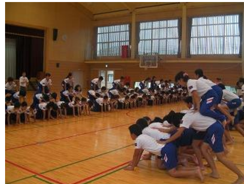
「運動会特別日課スタートしました！」(2016年9月14日)

今日から運動会特別日課が始まりました。早速1校時に全校練習があり、体育主任の先生から練習を進める上で大切なことの説明がありました。その後、入場行進と開会式の練習を行いました。いよいよ運動会に向けての取り組みが始まったことを実感しました。