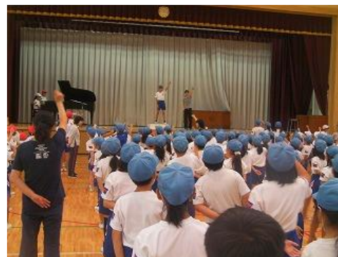
「運動会の歌練習」(2016年9月26日)