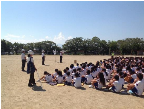
「PTA 親子早朝作業」(2016年9月5日)

9月3日(土)にPTA 親子早朝作業を行いました。保護者の皆様が校舎内の子どもたちが手の届かない場所の清掃を、子どもたちが校庭の除草作業を担当してくれました。おかげさまで学校がとてもきれいになりました。ご協力ありがとうございました。