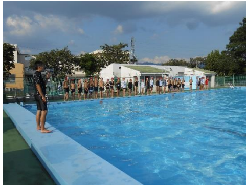
「組立合同練習2」(2016年9月13日)

9月13日(火)6校時に組立の合同練習を行いました。6年生が5年生に技を教える形が進んでいき、そのおかげで5年生もみるみる上達していきました。明日からは、運動会特別日課が始まります。健康・安全に留意して、素晴らしい運動会を作り上げていきたいと思えます。