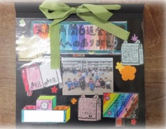
6年生への感謝の気持ちを綴った色紙をプレゼントしました。