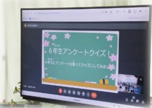
6年生にまつわるクイズで盛り上がりました。