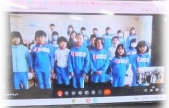
「ありがとうの花」の合唱と「呼びかけ」を各教室から6年生へ届けました。