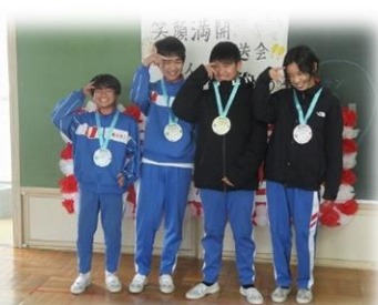
今日の主役、6年生です。オリジナルポーズで登場です。