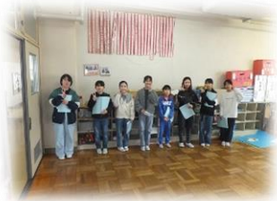
新児童会役員さんの初めての大きな行事です。

2月22日（木）に、「6年生を送る会」が行われました。卒業式は、学校行事として厳粛な式として行われますが、この「6年生を送る会」は、新児童会が企画・運営する子どもたちの手作りの会です。今年度、学校をリードしてくれた6年生に、「お世話になったことへの感謝」と「中学生へと飛躍することへの応援」の気持ちを込めて行いました。温かな雰囲気の中で、楽しさと寂しさを皆が感じる時間となりました。6年生は、残り少なくなった小学校生活の風景をじっくりと味わい、卒業式を迎えてほしいと思います。なお、この会の中心となった5年生の活躍ぶりは、素晴らしいものでした。