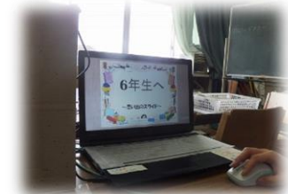
スライドで6年間を振り返りました。