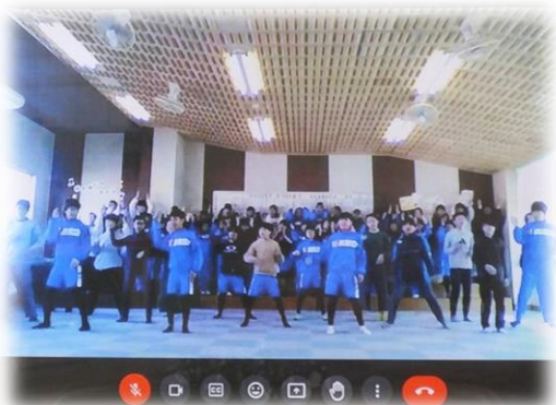
劇を通して、6年生が在校生にエールを送りました。