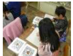
【ハンカチを見ながら】