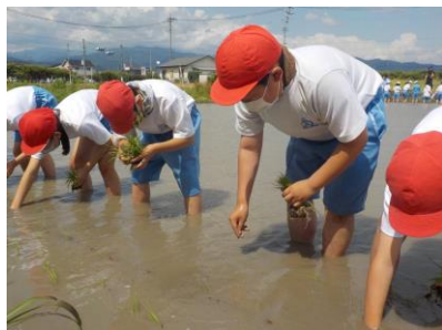
【5年生：田植えの様子から】

今年度も農業体験を実施しています。2年生のさつまいも、3年生のやはたいも、5年生の稲作。どの活動も学校で取り組むから体験できるという児童も多くなっています。これらの活動が学校で出来るのは『胞子の会』の皆様のご協力があってこそです。ありがたい体験をさせていただきます。子供たちもここで体験することで自分たちの食べ物がどんなに苦労して育てられているのか、自然の恵みがどんなに有り難いことかなど、1年間の活動を通して肌で感じると思います。学校でも貴重な学びを大切にしていきたいと考えています。