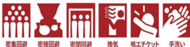
密集回避 密接回避 密閉回避 換気 咳エチケット 手洗い

家族でのルール作りと保護者の見守りは必ず必要です。夏休みに是非確認をお願いします。