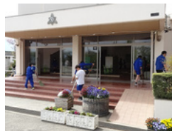
掃除を頑張ってます