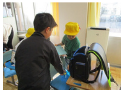
6年生が1年生のお手伝い