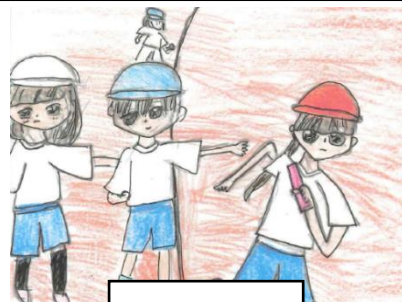
絵 早川 愛華