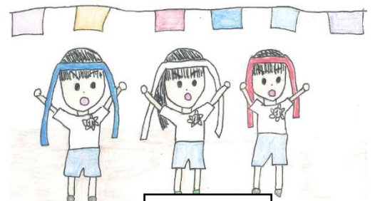
絵 重川 結