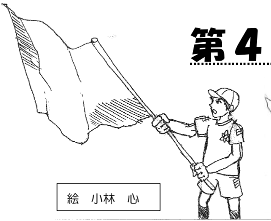
絵 小林 心