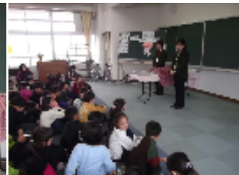
2年生 いのちの学習