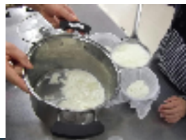
3年生 とうふづくり

平成32年度から新学習指導要領が全面実施となり、3、4年生は外国語活動が週1時間、5、6年生は外国語科が週2時間導入されます。平成30年度からは移行措置となり3、4年生は年間15時間、5、6年生は年間50時間実施されます。5、6年生は週1時間の授業のほかに、朝15分ずつの「モジュール学習」と呼ばれる短時間学習を取り入れます。3回で1時間分の授業にカウントします。この方式は甲斐市の全小学校で実施します。2年間で少しずつ増やし、平成32年度の本実施に備えます。