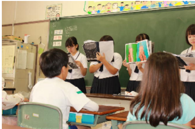
竜王北中生徒による「読み聞かせ」