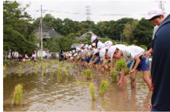
5年生「田植え」 慈照寺の南