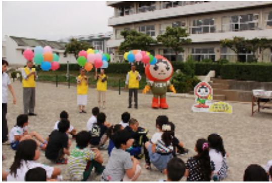
4年生「人権の花運動」 手紙を付けた風船を飛ばしました。どこまで飛んでいったでしょうか。