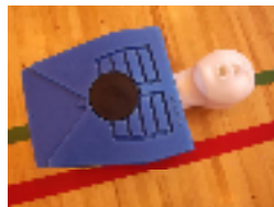
講習で使った人形