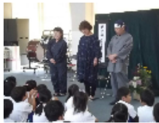
山梨むかしがたりの会 2年「甲州弁で民話」