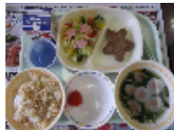
星がいっぱい 「七夕給食」