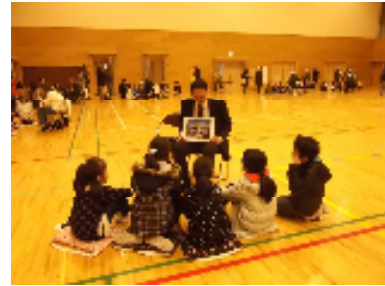
2分の1成人式の様子（4年）