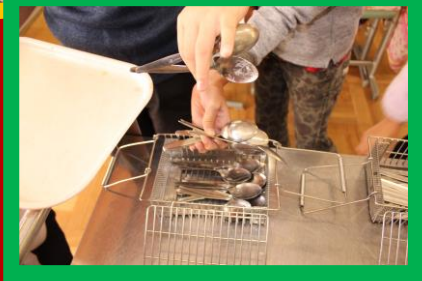
給食委員会の片付け調べ