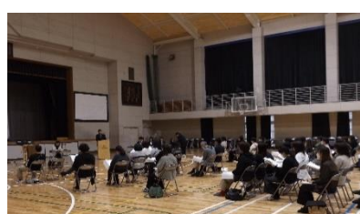
各学年 PTA 総会の様子