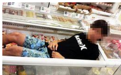
インターネットに投稿された画像「食品を入れる冷凍庫に入っている人」