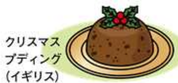
クリスマス プディング (イギリス)