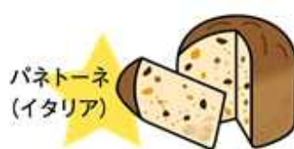
パネトーネ (イタリア)