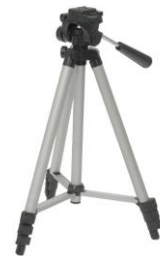
三脚は短くして使用