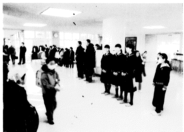
大きな声であいさつをしてくれました

十二月十六日(月)に、このところ恒例になっている「竜王中学校小中連携あいさつ運動」が行われました。朝早くから竜王中学校の生徒会・学年生徒会に属する竜王東小学校の卒業生たち(二年生と三年生)、先生方が来て、あいさつ運動をしてくれました。 竜王東小学校に來た竜王中生は、久しぶりに入った校舎に懐かしさを感じていたようです。また、小学校時代にいた先生に笑顔を見せた。この日のあいさつ運動は普段行っていないあいさつ運動と雰囲気の違いが、昇降口から入ってくる子ども