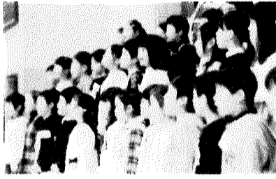
3年生合唱「少年少女冒険隊」