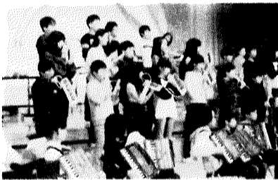
6年生合奏「シング！シング！シング！」