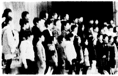
5年生合唱「ケ・サラ」