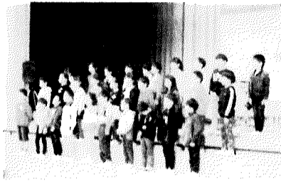
1年生斉唱「南の島のハメハメハ大王」