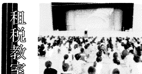
落ち着いた式でした

八月二十八日(水)に、六年生を対象に「租税教室」を、講師をお迎えして行いました。税金の使い道などを学ぶことができました。十月から消費税率が上がりそうです。関心も高いようでした。