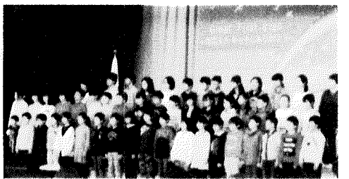
6年生がお迎いの言葉を言いました