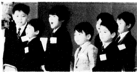
元気に「ありがとうございます」