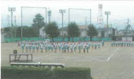
5・6年生 組立隊形の確認

第三十一回秋季大運動会まであと十日ほどとなりました。各学年はじめ高中低学年ブロッグごと、紅白組ごと