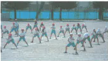
3・4年生 息の合った演技