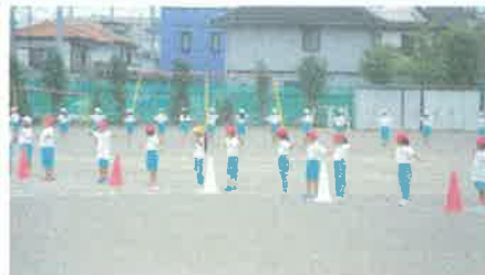
1・2年生 可愛い演技

第三十一回秋季大運動会まであと十日ほどとなりました。各学年はじめ高中低学年ブロッグごと、紅白組ごと