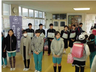
小中連携あいさつ運動