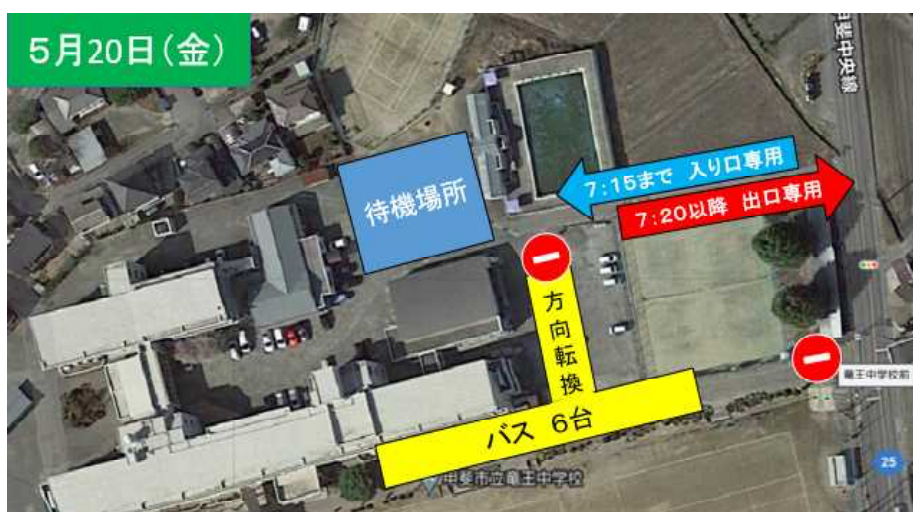
テニスコート北側の通路