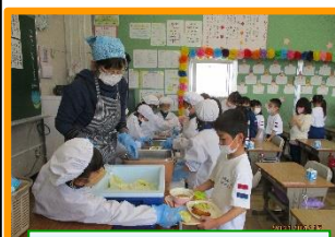
自分たちの手による配膳