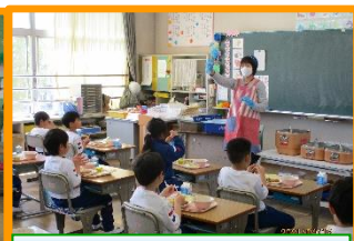
袋からのストローの取り出し方