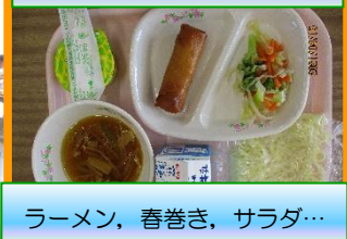
ラーメン、春巻き、サラダ…