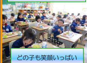
どの子も笑顔いっぱい