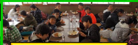
あっという間に食べきったカツカレー