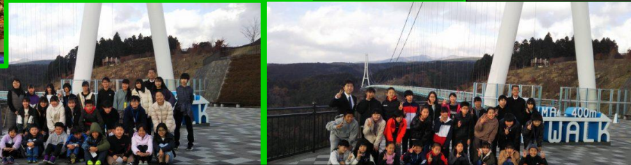
ちょっぴり怖かったけど最高の眺めだった日本一の大吊橋 三島スカイウォーク