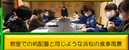
教室での机配置と同じような浜松の食事風景