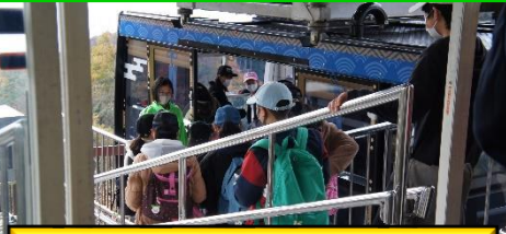
日本平ロープウェイは本校児童のみの乗車