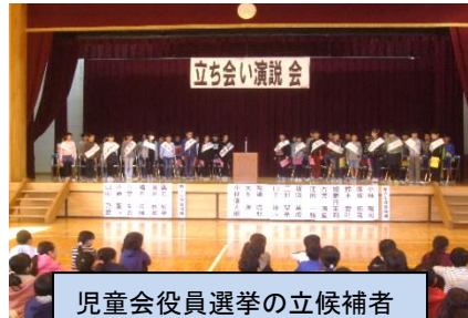
児童会役員選挙の立候補者立会演説会・投開票 (12/5)