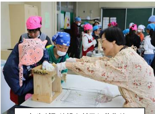
5年生が取り組んだ干し芋作り。 第3回の学校運営協議会でも参加者に振る舞われました。

今月も多くの皆様に学校の教育活動に関わっていただきました。子どもたちの充実した活動には、必ずと言っていいほど学校応援団の方々活躍がありました。いつも学校応援団の方々支援してもらえる本校の子供たちは幸せです。日頃からの感謝の気持ちを表そうと、「ありがとう運動」として子供たちもメッセージを書きました。西小まつりにも紹介いたしました。現在も階段に掲示しています。