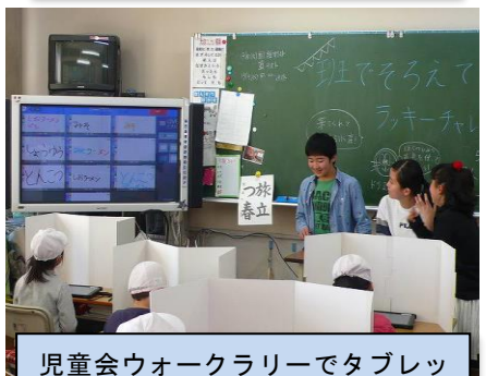
児童会ウォークラリーでタブレットと電子黒板によるクイズ (12/17)