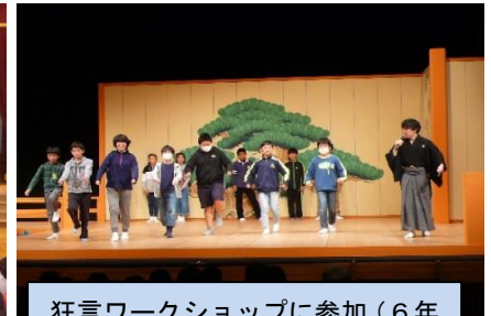
狂言ワークショップに参加 (6年12/12 コラニー文化ホールにて)