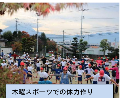
木曜スポーツでの体力作り縄跳び等で新記録も続々と!