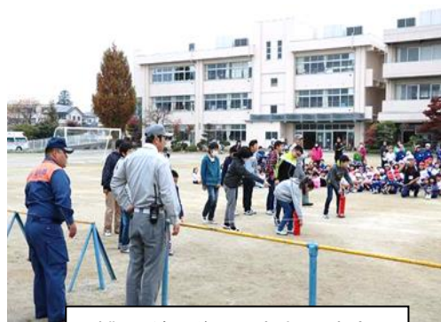
避難訓練の後に行われた消防署員の指導による消火訓練。 代表で6年生が体験しました。