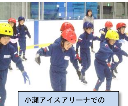
小瀬アイスアリーナでのスケート教室 (3.4年12/6)