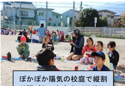
ぽかぽか陽気の校庭で縦割り班ごとのお弁当 (11/21)