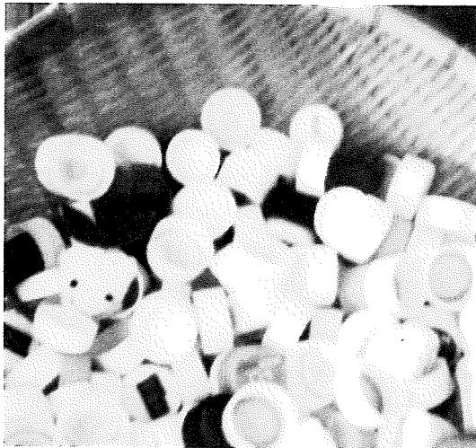
見つけれられたかな?

「ここで掲載しきれない活動は、学校応援団ブログに多数掲載中です。ぜひブログもご覧下さいね!」 次回は、十月頃の発行を予定しています。お楽しみに♪