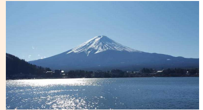
（河口湖からの富士山）

中学生も部活動や面接の練習があったり、目標を決めて学習に励んだり、遊びに行ったり、地域の行事に参加したりとそれぞれの冬休みだったと思ひます。