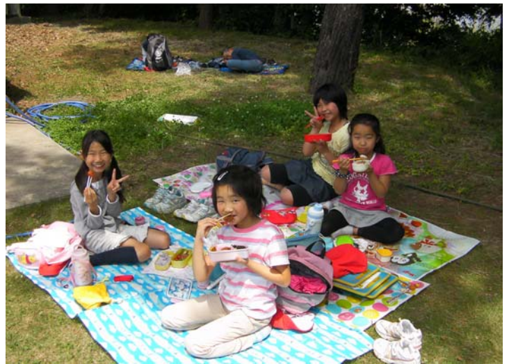
ワイナリーの広場で楽しくお弁当タイム