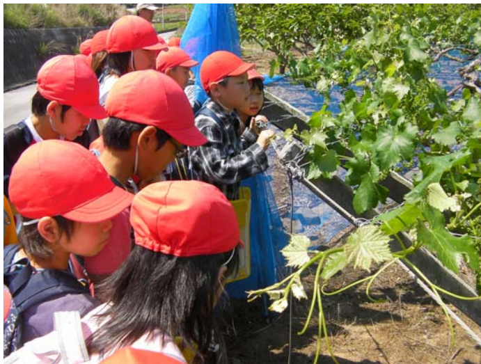
ぶどう畑では、小さな実ができていました。

みんなでやり遂げた最初の大会の遠足でいろいろなことを学んできました。話をしっかりと聞くことから理解が進むこと、交通ルールを守りながらの歩行に気をつけること、声をかけあつての励まし合いがうれしいこと、友達の頼もしさ、などなどです。